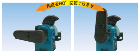
ラバーエンドレスベルト